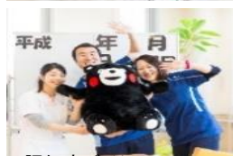
認知症デイケア やる気満々のスタッフ(笑)