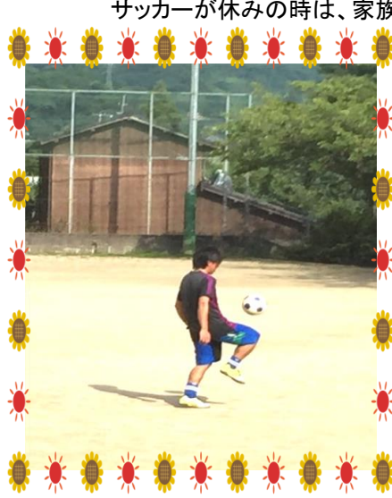
小学校の運動場で一枚