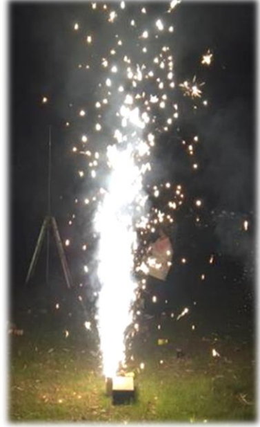
～約1分間続く吹上花火～